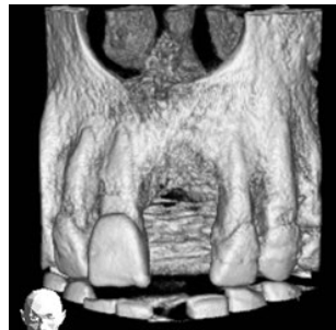
DVT (Digitale Volumentomographie) (Kieferdefekt)