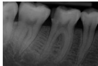
Erkrankter Zahn mit tiefer Karies, Entzündungszeichen an der Wurzelspitze sichtbar.

Eine Wurzelbehandlung stellt die letzte Möglichkeit dar, den betroffenen Zahn zu erhalten. Sonst muss der Zahn entfernt und die entstandene Lücke mit einem Implantat oder einer Brücke versorgt werden.